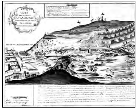
«Catálogo de mapas y planos del Virreinato del Perú y Chile» del Archivo General de Indias de Pedro Torres Lanzas.

ta del máximo José»... Con que si vos escogisteis por el mejor Patrón a San José, yo os elijo por Patrona como a la mayor devota de mi Señor San José».