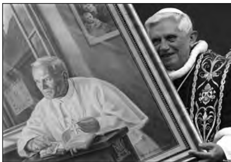
La iglesia de Wadowice regaló a Benedicto XVI un cuadro de Juan Pablo II en agradecimiento.

N o es necesario decir que el beato, y próximamente santo, Juan Pablo II (1920-2005) ha sido uno de los papas más devotos de San José y uno de los más decisivos impulsores del amor bien fundado al esposo de María y padre de Jesús. Su pontificado (1978-2005), el más largo después del de Pío IX, fue una permanente manifestación de esta relación cordial y evangélica con San José. No había ocasión propicia, lo mismo homilias que viajes, que celebraciones especiales, que no aprovechara para proponer a San José como modelo y como protector bueno de la Iglesia, de las familias, de las personas en sus diversos estados. En este sentido, Juan Pablo II quebró la relativa atonía magisterial desde que León XIII publicó la primera (y única) encíclica dedicada a San José (« Quamquam pluries », 1889), al regalar (a los cien años, en 1989) la profunda y cálida exhortación apostólica « Custodio del Redentor ».